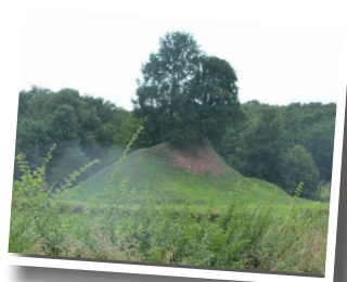
Motte de Presles

Au pied de cette motte à droite, était édifée une chapelle démolie peu avant 1800 et un cimetière. Sur le sommet une tour où se réfugiait le seigneur sa famille et sa garde.